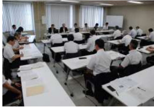
各課懇談会・3つの分科会で開催

後半では3つの分科会に分かれて、各課の課長・主幹クラスの方と、ひざを交えながら教育施策について話し合いを持つ場である「各課懇談会」を行っています。