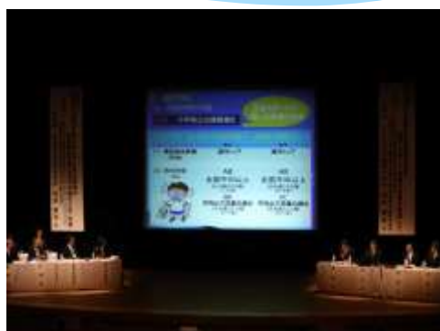
第4分科会 北海道発表