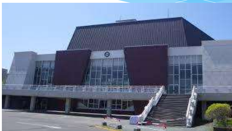
令和元年度道小研究大会 胆振・苫小牧大会