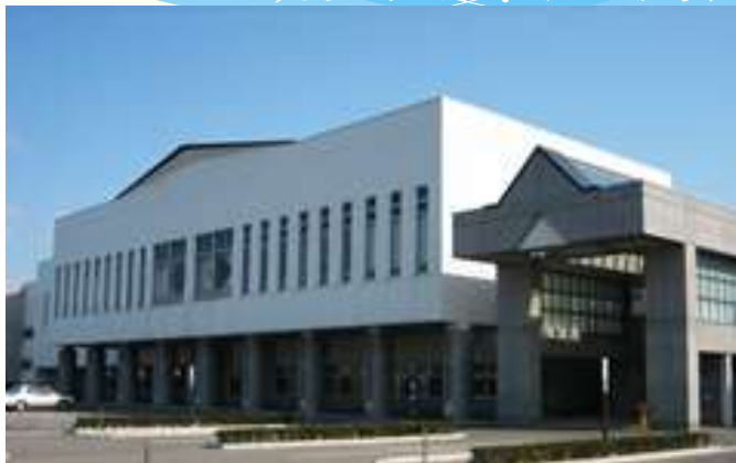
令和元年度 秋田大会 秋田県立武道館