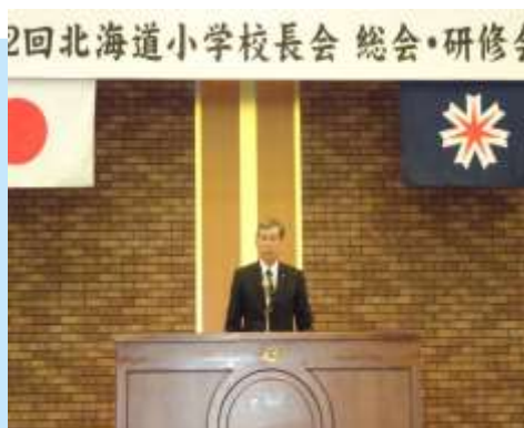
北海道小学校長会 総会・研修会