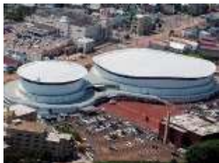
平成30年度 函館大会