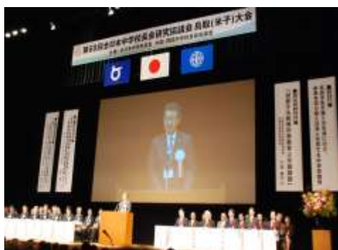
平成30年度 鳥取(米子)大会 開会式