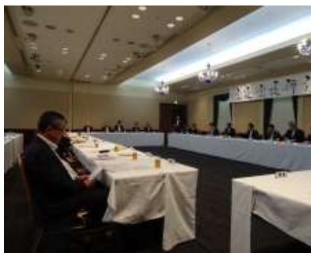
北海道小学長会・全道20地区会長

道小では、毎年6月に「会長研修会」が開催されています。全道20地区の会長と、所管する対策部、へき複連、道特協、事務局員全員が参加しています。