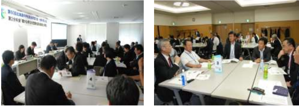
分科会での話し合い

道中では5つの分科会に分かれ、道小と同様にグループ協議を取り入れた充実した分科会となっています。