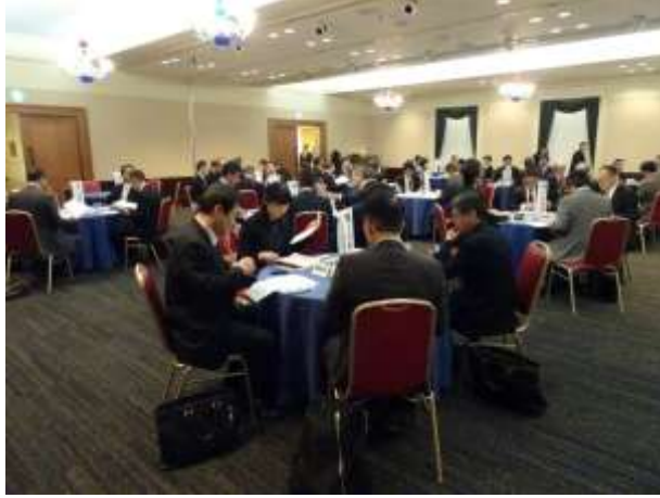
道小 研究大会前に3回開催(5・7・9月)