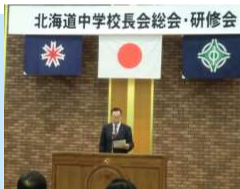
北海道中学校長会 総会・研修会

これは、道小・道中でそれぞれ開催している総会・研修会の場面です。全道の各地区からの理事や代議員などの会員の皆様にご出席いただき、開催しています。