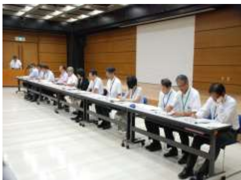
北海道教育委員会側