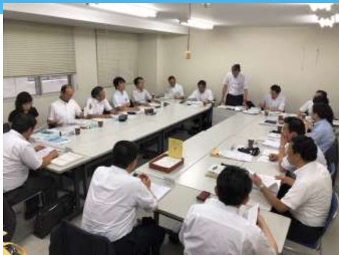
事務局研修会 道小年14回・道中年9回