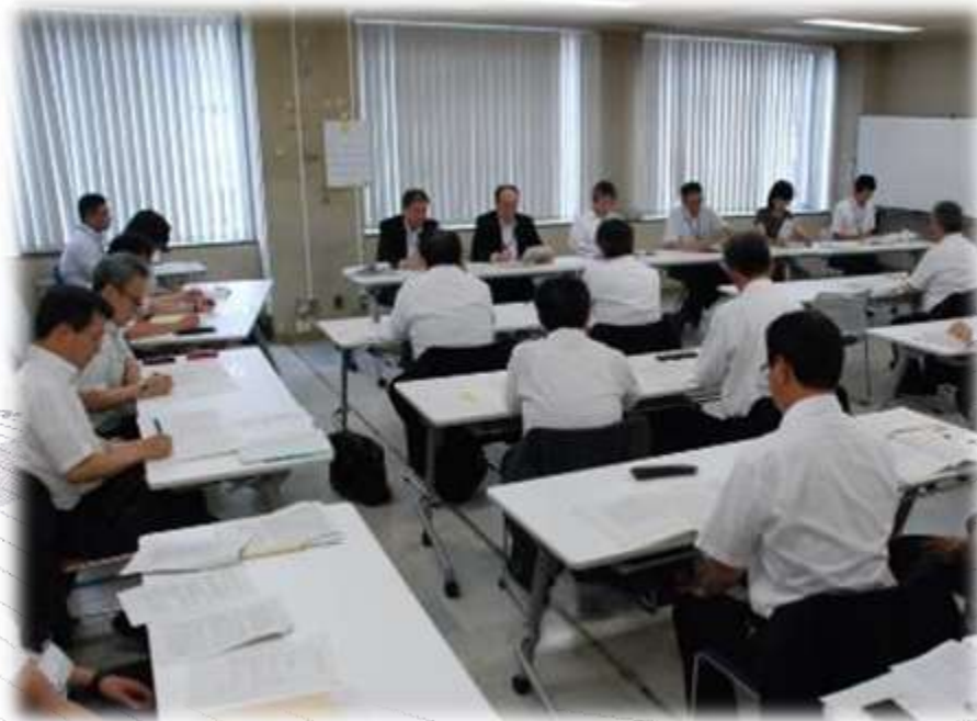
各課懇談会・3つの分科会で開催