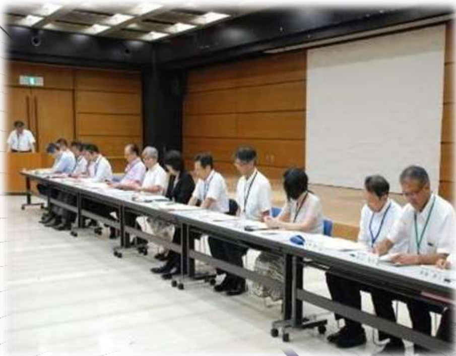
北海道教育委員会側